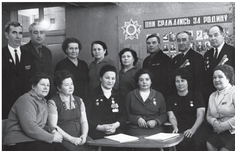
Рис. 8. Сотрудники института – ветераны Великой Отечественной войны